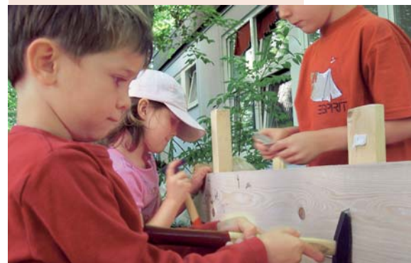
Die Verbund-Kindertagesstätte „Bärcheninsel“ betreut derzeit 65 Kinder im Alter von sechs Monaten bis zehn Jahren.

Mittlerweile werden dort 65 Kinder im Alter von sechs Monaten bis zehn Jahren betreut. Der Träger des Kindergartens, Kind e.V., erhält von der Stadt Stuttgart dieselben Zuschüsse wie öffentliche Einrichtungen. Im Gegenzug bietet die „Bärcheninsel“ Kindergartenplätze auch für Anwohner des Stadtteils. Das Modell hat in Stuttgart Schule gemacht: Heute betreut Kind e.V. sechs ähnlich konzipierte Einrichtungen für insgesamt 22 Unternehmen. Mehr Info: www.kita-baercheninsel.de .