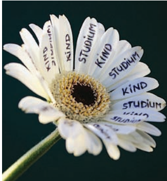
Siegerbeitrag des 21. Plakatwettbewerbs „Kinder? Kinder!“ des Deutschen Studentenwerks

tens ein Kind haben. Bei der Auswahl ihrer Seminare können sie nicht nur nach Interessenslage handeln, sondern müssen auch die örtliche Betreuungssituation berücksichtigen. Veranstaltungen am Abend oder am Wochenende fallen oft völlig flach, weil es keine ausreichende Kinderbetreuung gibt. Der Bericht zeigt: Studierende mit Kind unterbrechen ihr Studium viermal häufiger – im Schnitt für fünf Semester.