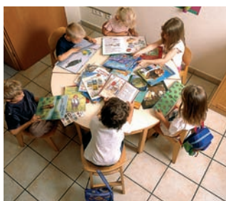
Lesen unterm „Regenbogen“

INITIATIVE Im Verbund mit etwa 40 klein- und mittelständischen Firmen gründete der Kreis Junger Unternehmer Iserlohn (KJU) Anfang der 1990er-Jahre einen Trägerverein, der 1992 den Kindergarten „Regenbogen“ eröffnete. Der Impuls kam aus den Reihen der Unternehmer, die zu dieser Zeit nach Lösungen suchten, qualifizierte Beschäftigte nach der Geburt eines Kindes schnell wieder in den Beruf zurückzuholen. Begonnen hatte alles mit einer Gruppe von 20 Kindern und zweieinhalb Stellen für Erzieherinnen. Heute