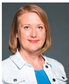
Lisa Paus MdB, Bundesministerin für Familie, Senioren, Frauen und Jugend

„ Unternehmen, die Frauen und Männern gute Angebote zur Vereinbarkeit von Beruf und Familie machen, profitieren stark im Ringen um Fachkräfte. Und sie nutzen das Fachkräftepotenzial, das in der Erwerbsbeteiligung von Frauen steckt. Das Unternehmensnetzwerk macht gerade mittelständischen Betrieben zahlreiche Angebote, bietet Ideen und Praxisbeispiele sowie vielfältige Möglichkeiten, betriebliche Erfahrungen auszutauschen. Deshalb lade ich Sie ein: Werden auch Sie Mitglied in unserem Unternehmensnetzwerk „Erfolgsfaktor Familie“..